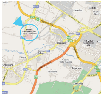
AOU S. Luigi Gonzaga - Regione Gonzole 10, Orbassano